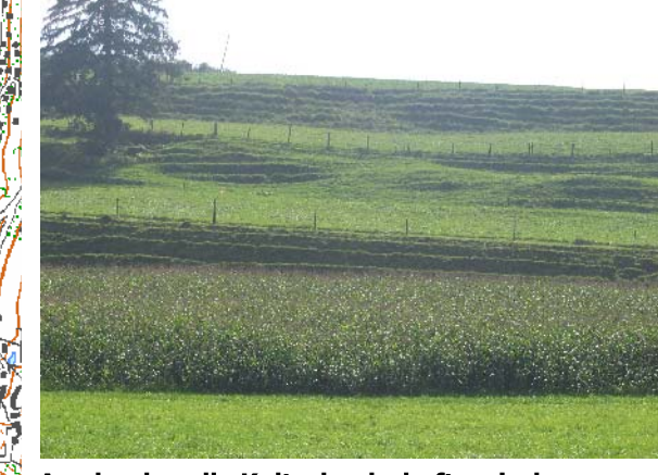
Ausdrucksvolle Kulturlandschaft zwischen Bibruck und Taldorf