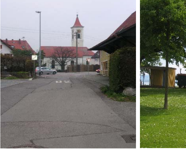
Kirche in Fischbach Möglicher Kunststandort am Fildenzplatz