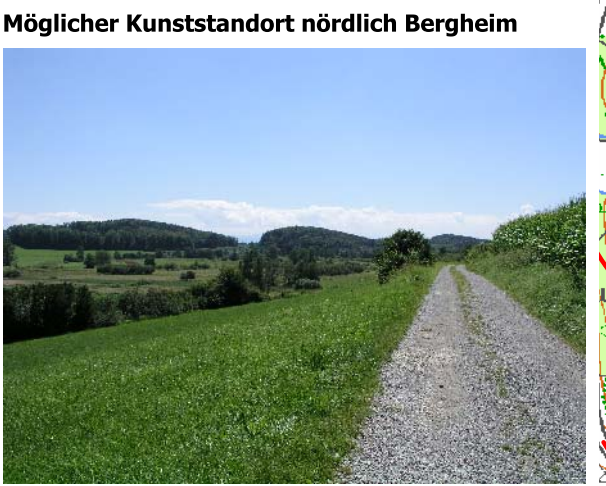
Möglicher Kunststandort nördlich Bergheim Hutwiesen (Hepbach-Leimbacher Ried)