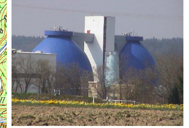
Möglicher Kunststandort Kläranlage Langwiese