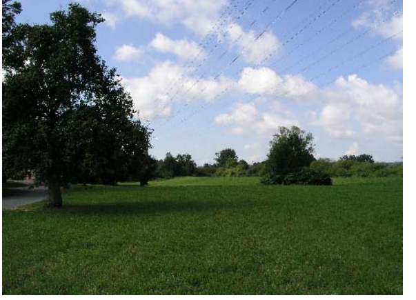
Möglicher Kunststandort an der geplanten B 30 neu