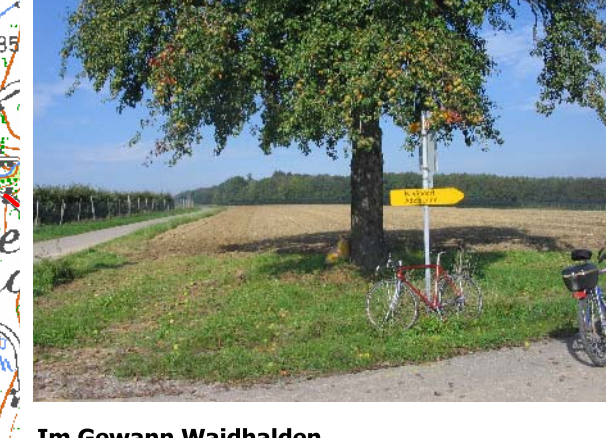
Im Gewann Waidhalden