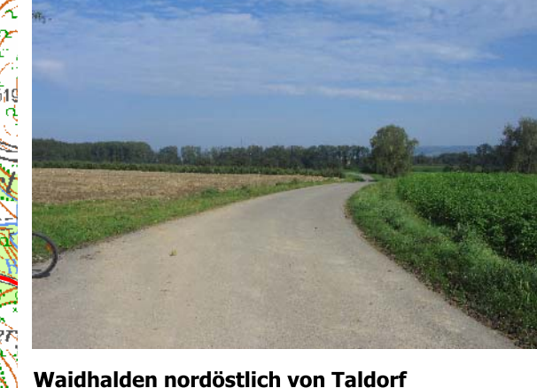
Waidhalden nordöstlich von Taldorf