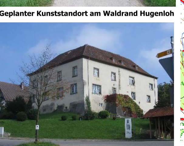
Geplanter Kunststandort am Waldrand Hugenloh Schloss in Efrizweiler